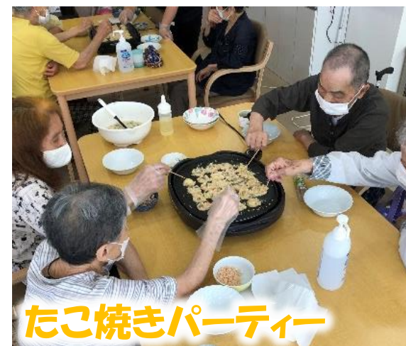
たこ焼きパーティー